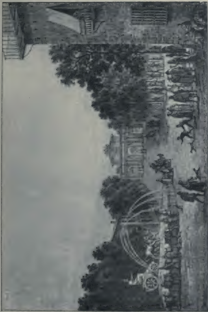
Madrid : La fontaine de Cybèle et la porte d'Alcala.

Dessin de Bacler d'Albe. Lithographie de G. Engelmann. (Bibliothèque Nationale. Estampes.)